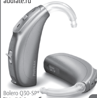
Boleero Q30-SP* 34 580 руб.

СЛУХОВОЙ АППАРАТ от швейцарского производителя